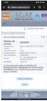
DEP.COL III 2DA INS.jpeg 100K