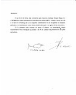
CARTA ACOSTA Y ARIAS FIRMADA.jpg 467K