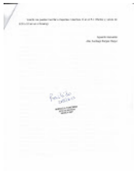
RECEPCIÓN EXPEDIENTE 008460-000211-23.jpg 402K