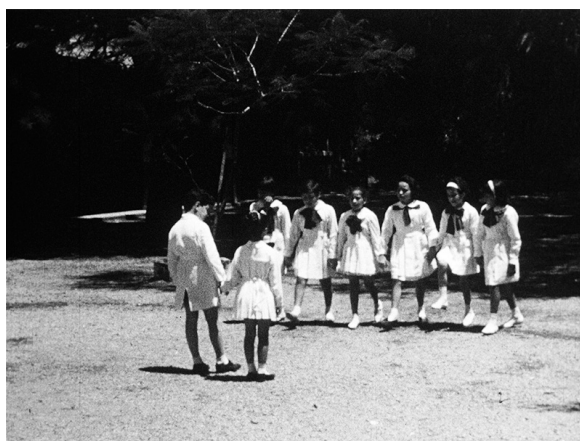
Imagen 3. Niños jugando al andelito de oro. Fotograma de película del acervo del Archivo General de la Universidad de la República. Código de referencia: UY UDELAR AGU AIH-I-ICUR-01-2. Título: Juegos y rondas tradicionales del Uruguay. Fecha de creación: 1966.

Después arrojaban el diente por sobre las bardas de la casa, porque las ratas hacen sus nidos en las bardas viejas. La razón asignada para invocar a las ratas en estas ocasiones era que, según los nativos, los dientes de rata son los más fuertes que se conocen. (Ayestarán, 2018: 17)