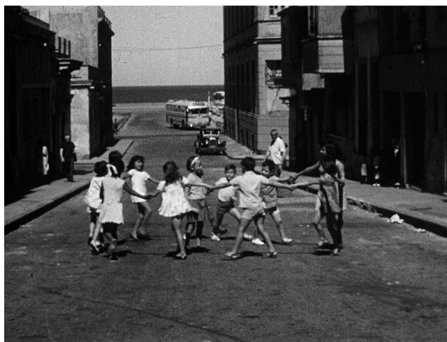
Imagen 1. Ronda de niños jugando a la farolera. Fotograma de película del acervo del Archivo General de la Universidad de la República. Código de referencia: UY UDELAR AGU AIH-I-ICUR-01-2. Título: Juegos y rondas tradicionales del Uruguay. Fecha de creación: 1966.

o de los entrevistados, de la ruta de aprendizaje/transmisión de lo grabado, de las características del contexto comunitario, de los materiales grabados en sí mismos, etc.), y, en la medida de lo posible, imagen del intérprete y de su hábitat.