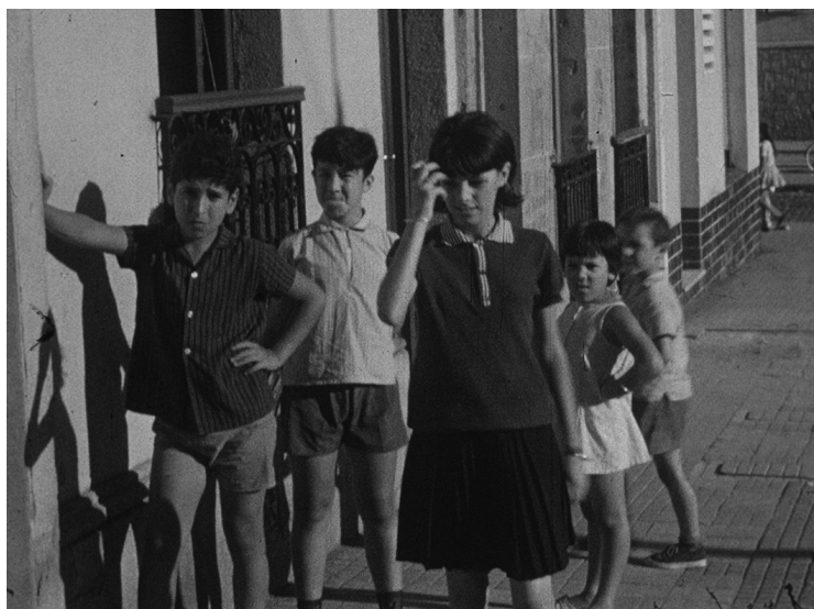
Imagen 4. Niños jugando a la rayuela. Fotograma de película del acervo del Archivo General de la Universidad de la República. Código de referencia: UY UDELAR AGU AIH-I-ICUR-01-2. Título: Juegos y rondas tradicionales del Uruguay. Fecha de creación: 1966.

El trabajo realizado por Lauro Ayestarán es la materialización de este carácter de “obra” que toman los juegos y las canciones infantiles. Su transmisión generacional pone en evidencia que hay un mundo humano que excede a cada uno de los individuos. Es un mundo que se actualiza en cada uno de ellos, con cada práctica, con cada una de las instancias en las cuales se inscribe a un ser hablante en el orden simbólico. Los juegos infantiles forman parte del patrimonio que hacen que cada niño se depare con un mundo ya existente, que lo excede, y con el que juega. No es necesario mostrar el mundo adulto que se esconde detrás de cada juego o canción infantil, a través del cual las niñas aprenden que “hacen así, así las lavanderas” y los niños declararán “tomo esta por esposa. Por esposa y por mujer”. 18 Aun cuando allí se organicen de forma explícita los parámetros culturales que rigen ciertas sociedades, hay, en cualquier juego y canción, más allá de sus formas, letras o melodías, la producción de una estabilidad con la que se encuentra cada generación que ingresa al mundo.