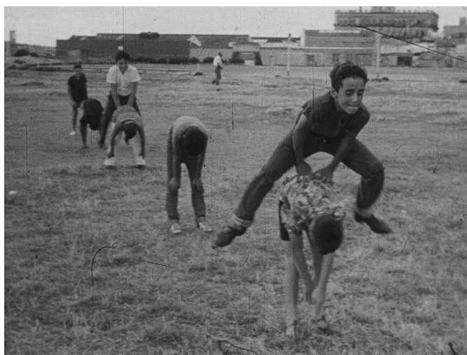
Imagen 2. Niños jugando al rango. Fotograma de película del acervo del Archivo General de la Universidad de la República. Código de referencia: UY UDELAR AGU AIH-I-ICUR-01-2. Título: Juegos y rondas tradicionales del Uruguay. Fecha de creación: 1966.

2007) se degrada en su imposibilidad de registro. Como señalaba Walter Benjamin (2003: 42): “Incluso en la más perfecta de las reproducciones una cosa queda fuera de ella: el aquí y ahora de la obra de arte, su existencia única en el lugar donde se encuentra”. Así también, en el juego, su más perfecto registro no puede incluir nunca el instante en el que se produce, lo original del acto de jugar, la experiencia propia del juego. El registro cinematográfico y textual podrán decir sobre lo imaginario de los juegos y rondas, sobre sus reglas, sus letras, las melodías y las coreografías, podrán inducirnos a la comprensión de los simbolismos en los que se incurre en el acto de jugar, en ese “ser de otro modo”, pero no conseguirán inscribir lo real del juego, así como nunca es posible un registro real de lo real, que permanece siempre al margen de toda representación y por tanto a su reproductibilidad técnica.